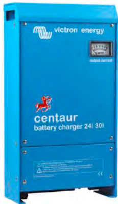
Centaur Battery Charger 24 30