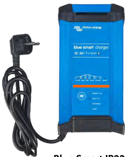
Blue Smart IP22 12/30 (3)