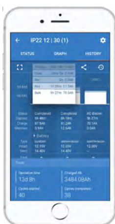
Una de las pantallas de historial